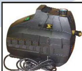
Compresseur 230 V - 100 l/mn sans télécommande de montée/descente mât

Le boîtier de télécommande sert tel qu'il est livré avec le compresseur, mais le câble de la télécommande peut être branché directement à un tableau déporté. (en cabine, etc..)