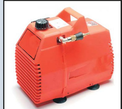
Compresseur 12 ou 24V - 166 l/mn sans télécommande