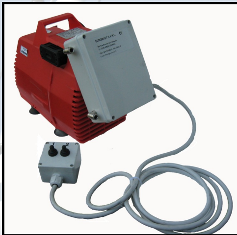
Compresseur 12 ou 24V 166 l/mn avec tél. filaire montée/descente pour 2 mâts