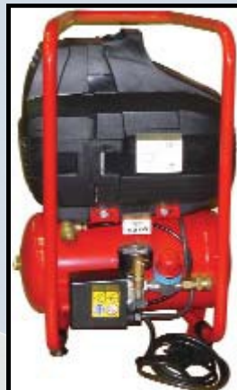
Compresseur 230V - 166 l/mn sans télécommande