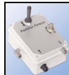
Boîtier de commande pneumatique avec joystick montée/descente mât.