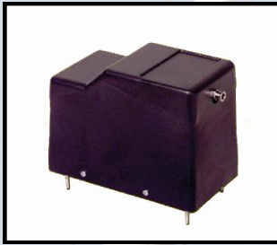
Compresseur 12 ou 24V - 50 l/mn sans télécommande