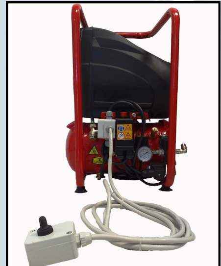
Compresseur 230V - 166 l/mn avec télécommande montée/descente

Le boîtier de télécommande sert tel qu'il est livré avec le compresseur, mais le câble de la télécommande peut être branché directement à un tableau déporté. (en cabine, etc..)